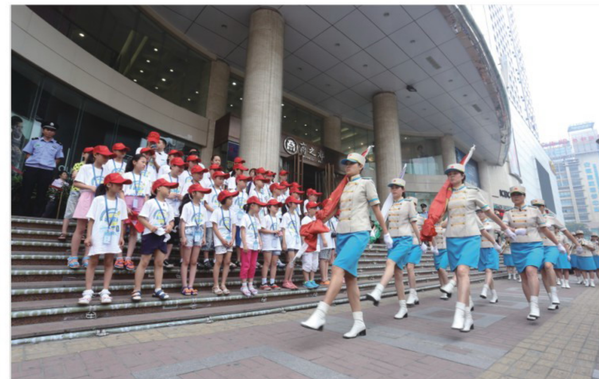
▲安徽商之都升旗仪式

热情接待来访，寻求解决方案。积极组织慰问困难党员职工、“金秋助学”、“送温暖”、“送清凉”等活动，传递组织关怀和温暖。迅速广泛动员救助突发重大疾病员工，真正体现“微商一家亲”。