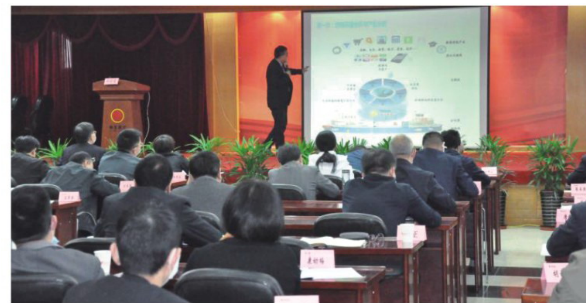
▲第十二期徽商大讲堂——企业顶层设计授课现场

举办9期徽商大讲堂，累计参训人数1200多人次。制定《徽商集团中层管理人员管理办法》，建立较为系统的管理机制和能上能下的使用机制。徽商期货公司博士后工作站成功获批。