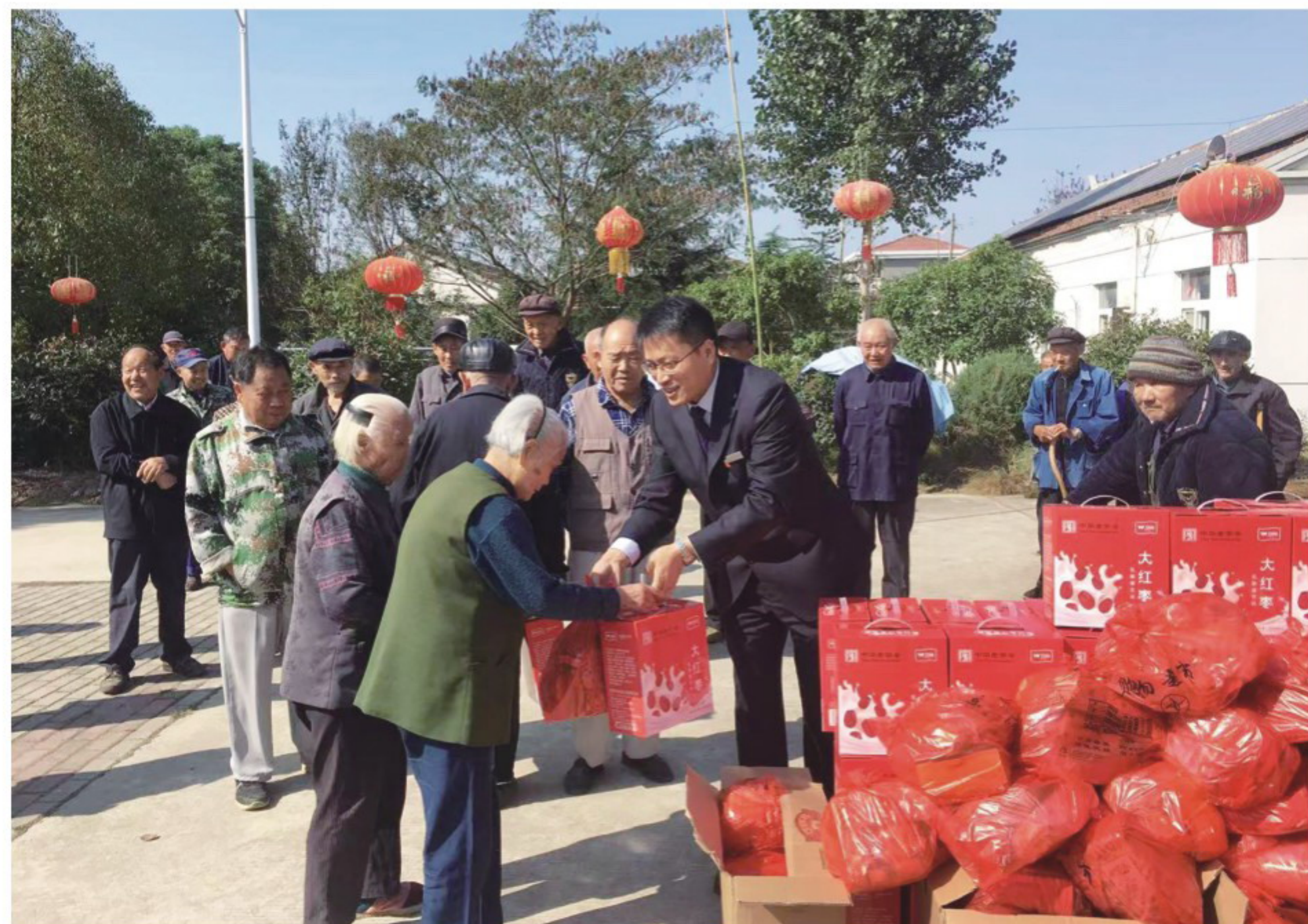
▲商之都巢湖商厦“志愿敬老行”活动

以打造现代流通综合服务商为目标，发挥流通业、服务业连通上下游优势，诚信经营，推进产业发展和客户成长。徽商期货公司为全国数百家实体企业提供专业服务，根据实体企业需要量身定制套期保值方案，帮助客户利用期货工具进行风险管理，有效规避了价格巨幅波动的风险，助力实体企业稳健增长。商之都推广“睦邻计划”，广泛开展服务客户的志愿活动。