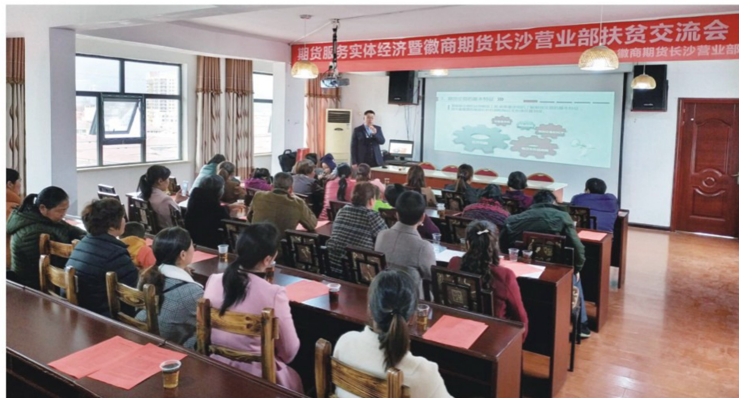
▲徽商期货扶贫交流会