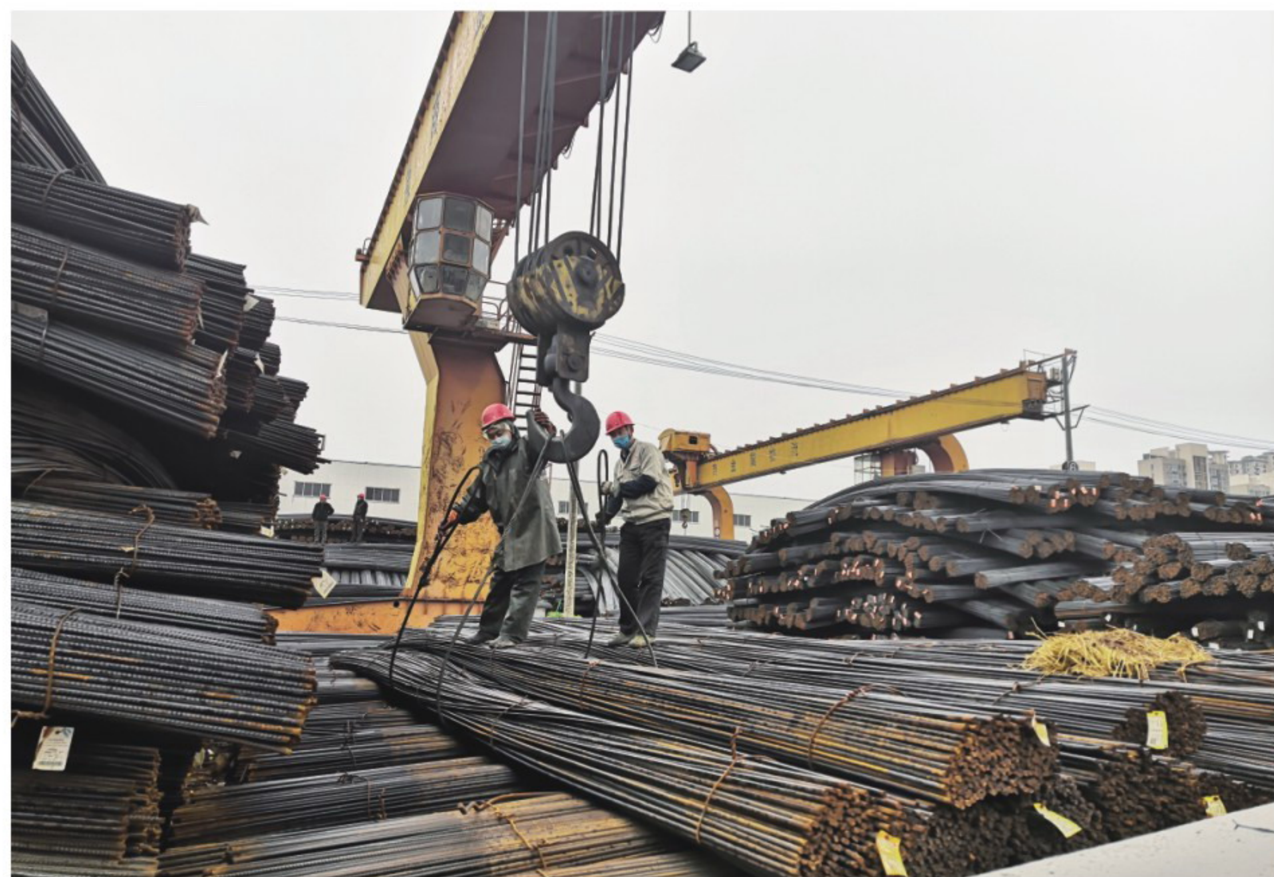
▲徽商物产钢材基地

纪要精神，与各债权银行就整体债务问题达成一致意见，增强金融机构信心，避免了金融风险。推进徽商创元公司问题处置进入法律渠道，信访量从近百起降至零上访。新组建法务风控部，成立防范化解重大风险工作领导小组和6个专项工作组，全面排查、应对各类风险隐患。二是加强制度建设。开展建章立制“回头看”，集团总部修订制度5项、新制定9项、废止12项。加强制度执行力建设，强化工作督办，集团总部印发督办通报37期。三是推进清单式管理。集团总部实行工作清单制度，建立完善资产、财务、人力、诉讼等数据库。四是强化母子公司管控。加强经营调度体系建设，强化预算指标分解落实，突出苗头性、异动性趋势分析。启动财务信息化建设，实行直属公司财务总监委派制，严控财务风险。组建审计督导部，强化审计整改对规范各公司经营行为的作用。