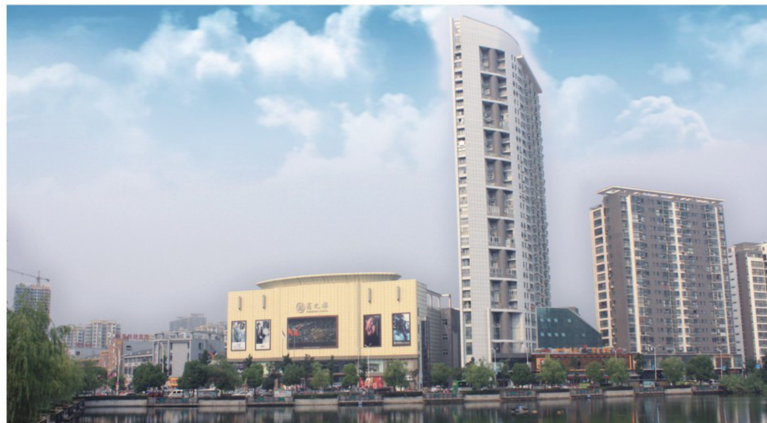
▲商之都六安商厦外景