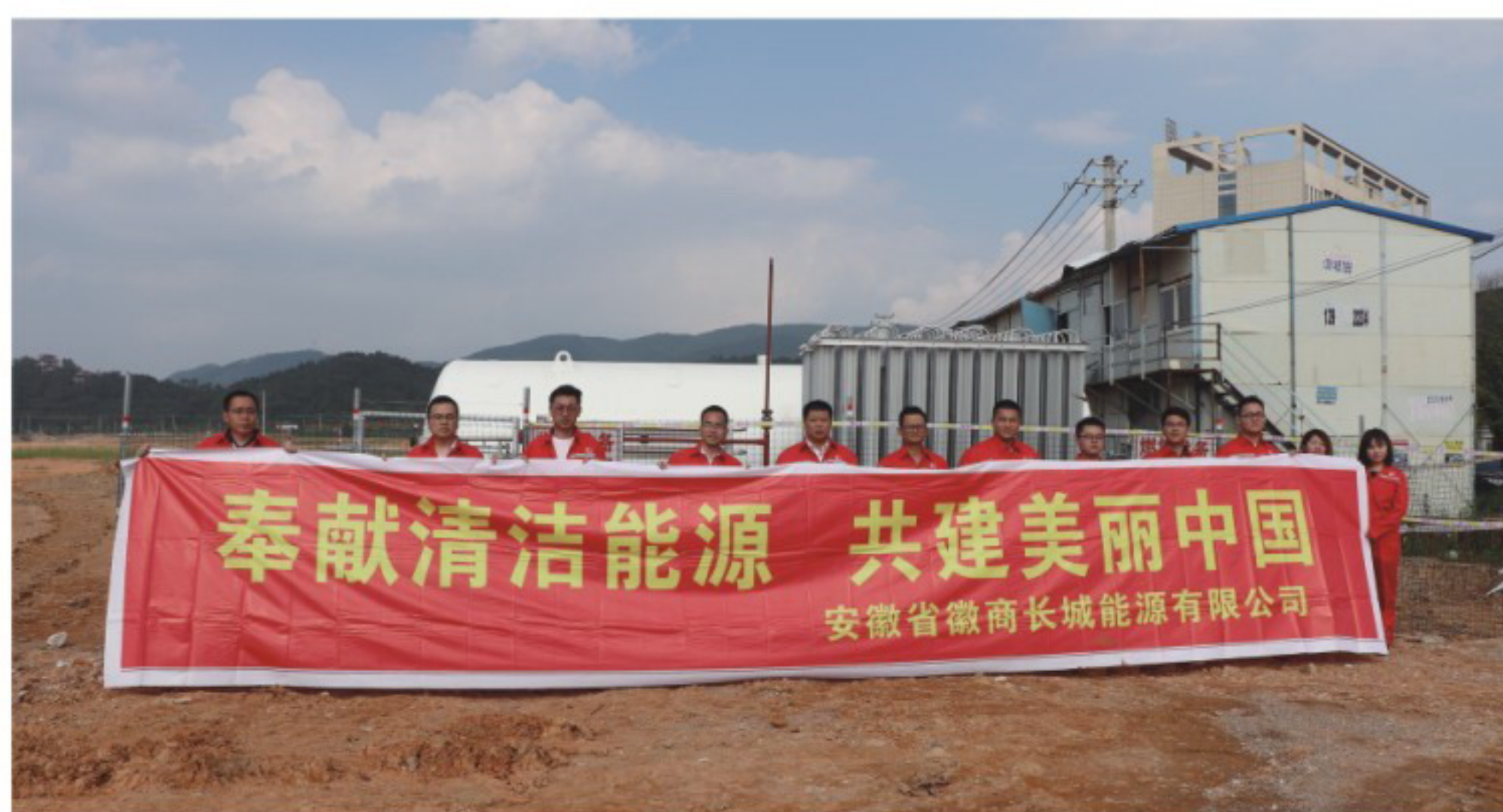
12月30日，徽商长城宿松支线通气点火仪式成功举行

与中石化合作成立徽商长城能源公司，开拓宿松天然气市场，实现公司当年组建、当年点火、当年盈利。