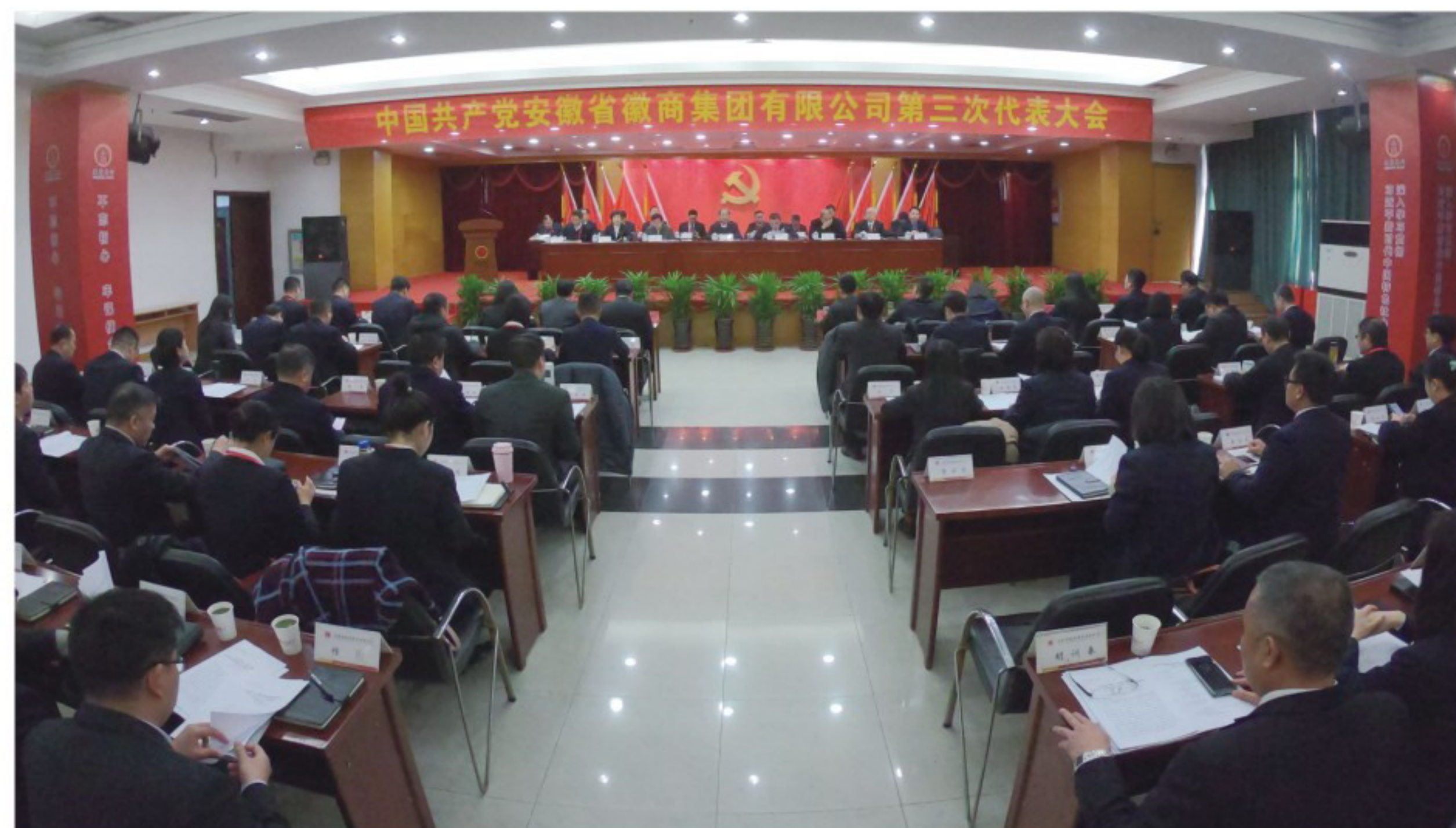
▲集团第三次党代会现场

2019年12月31日，中国共产党安徽省徽商集团有限公司第三次代表大会在集团二楼多功能厅隆重召开。